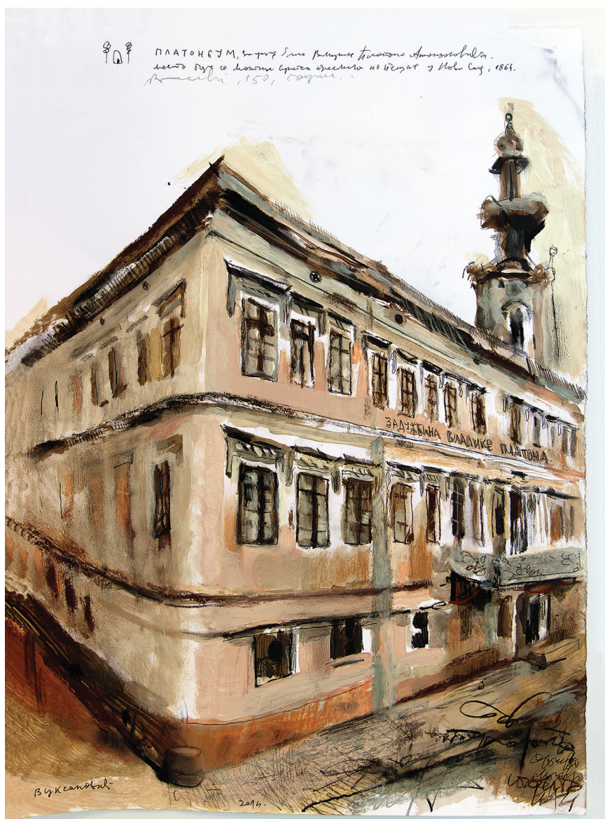
ПЛАТОНЕУМ, седиште Матице српске, 1864–1865 (аутор цртежа: Данило Вуксановић)