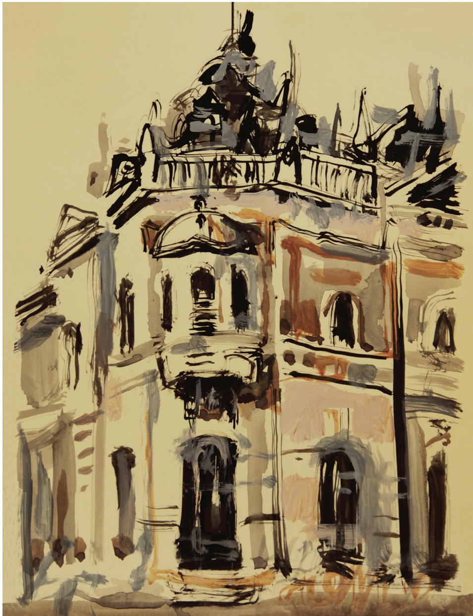
ЗАДУЖБИНСКО ЗДАЊЕ МАРИЈЕ ТРАНДАФИЛ, седиште Магице српске од 1928. (аутор цртежа: Данило Вуксановић)