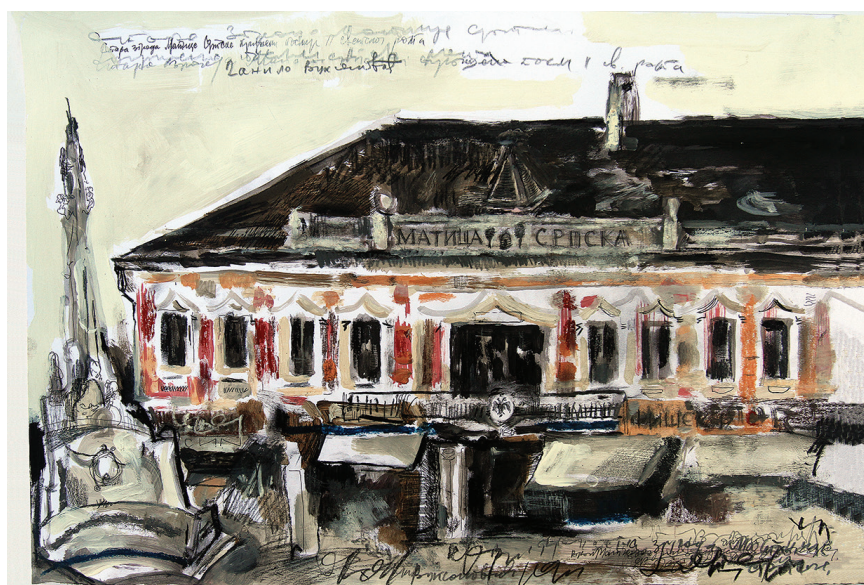
ПАЛАТА ЈОСИФА ГИЛМИНГА, седиште Матице српске, 1888–1928 (аутор цртежа: Данило Вуксановић)