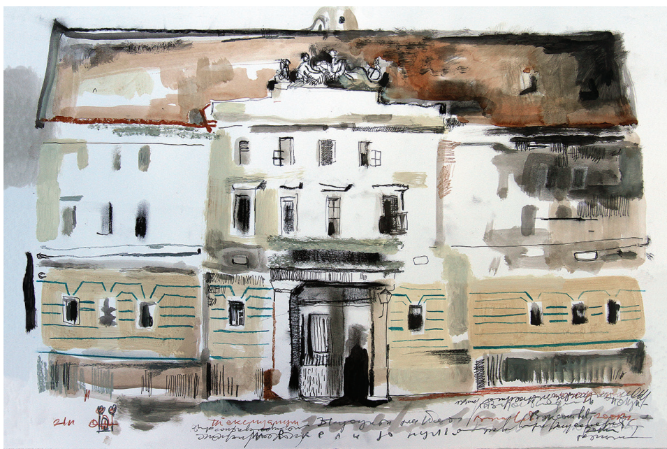
ТЕКЕЛИЈАНУМ, седиште Магице српске, 1838–1864 (аутор цртежа: Данило Вуксановић)